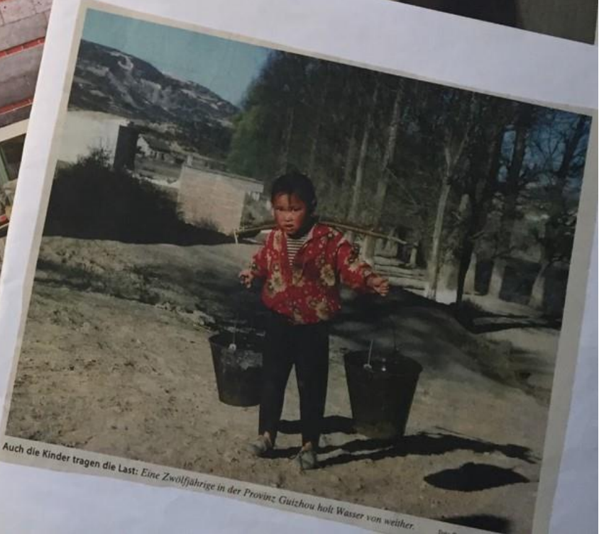
Auch die Kinder tragen die Last: Eine Zwölfjährige in der Provinz Guizhou holt Wasser von weiter.