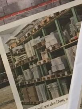
Wahrzeichen, Kulturgut und Dauerbaustelle: Die Kölner Dombaauhütte kümmert sich liebevoll um den Dom, u